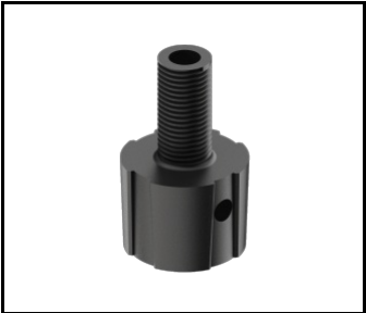
SKVER R Außengewindeadapter M20x40 (Steigung 2,5) (804427)