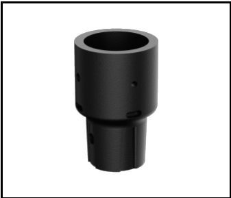
SKVER externer Adapter fi48 (804571)