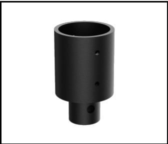
SKVER externer Adapter fi60 (804588)