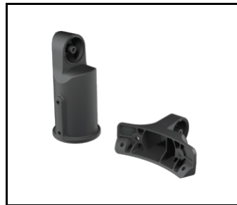
SKVER R Verstellbarer Griff Dark Sky schwarz (804618)

Erstellungsdatum der Karte: 24 April 2025