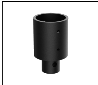
SKVER externer Adapter fi60 (804588)