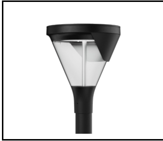
SKVER Backshield RAL9005 (435515)