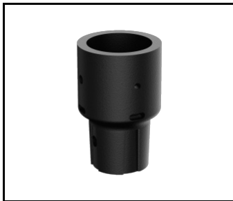
SKVER externer Adapter fi48 (804571)