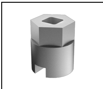
Klíč k otevření Tiary XS / Skver (584534)