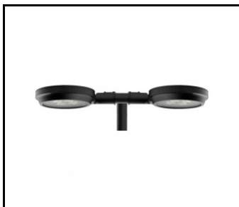
Výložník typu T RAL9005, konstrukce ø 88,9x5 + 2x ø 60,3x2,9 (150098)