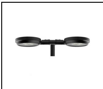
Výložník typu T RAL9005, konstrukce \varnothing 88,9x5 + 2x \varnothing 60,3x2,9 (150098)