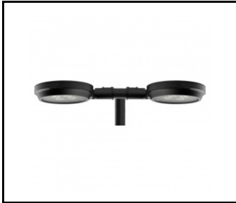
Výložník typu T RAL9005, konstrukce ø 88,9x5 + 2x ø 60,3x2,9 (150098)