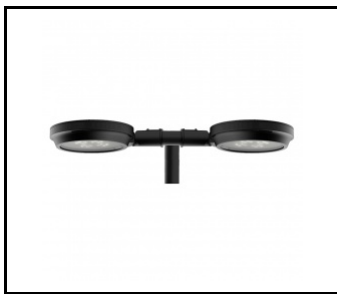
Výložník typu T RAL9005, konstrukce \varnothing 88,9x5 + 2x \varnothing 60,3x2,9 (150098)