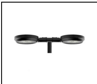
Výložník typu T RAL9005, konstrukce \varnothing 88,9 \times 5 + 2 \times \varnothing 60,3 \times 2,9 (150098)