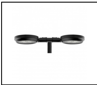
Výložník typu T RAL9005, konstrukce ø 88,9x5 + 2x ø 60,3x2,9 (150098)