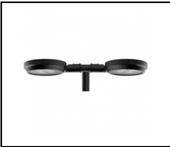
Bras T-type RAL9005 structure fi 88,9x5 + 2x fi 60,3x2,9 (150098)

Date de création de la carte:12 février 2025 Le fabricant se réserve le droit d'apporter des modifications au cours de l'amélioration du produit ainsi que des modifications de conception ou de modernisation du produit présenté. La fiche technique du produit n'est pas une offre commerciale * La tolérance des paramètres est de +/- 10 %