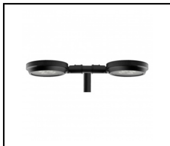
Bras T-type RAL9005 structure fi 88,9x5 + 2x fi 60,3x2,9 (150098)

Date de création de la carte: 12 février 2025