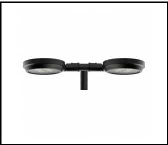
Bras T-type RAL9005 structure fi 88,9x5 + 2x fi 60,3x2,9 (150098)

Date de création de la carte:12 février 2025