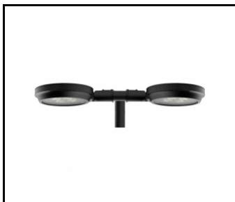
Bras T-type RAL9005 structure fi 88,9x5 + 2x fi 60,3x2,9 (150098)

Date de création de la carte: 12 février 2025