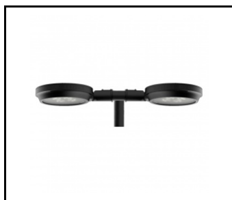
Bras T-type RAL9005 structure fi 88,9x5 + 2x fi 60,3x2,9 (150098)

Date de création de la carte: 12 février 2025