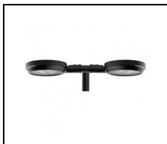
Ausleger T-Typ RAL9005 Struktur Ø 88,9x5 + 2x Ø 60,3x2,9 (150098)

Erstellungsdatum der Karte: 12 Februar 2025