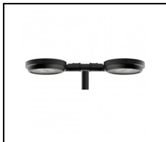
Ausleger T-Typ RAL9005 Struktur Ø 88,9x5 + 2x Ø 60,3x2,9 (150098)

Erstellungsdatum der Karte: 12 Februar 2025