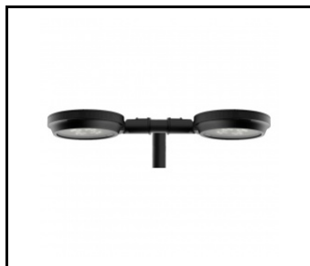
Wysięgnik T-type RAL9005 struktura fi 88,9x5 + 2x fi 60,3x2,9 (150098)