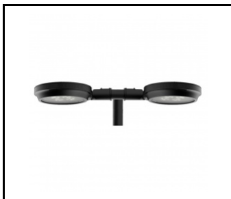
Wysięgnik T-type RAL9005 struktura fi 88,9x5 + 2x fi 60,3x2,9 (150098)