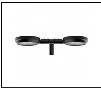
Wysięgnik T-type RAL9005 struktura fi 88,9x5 + 2x fi 60,3x2,9 (150098)