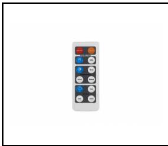
Bewegungsmelder und Dämmerungssensor HD01R (WSEL438)

Erstellungsdatum der Karte: 17 Februar 2025