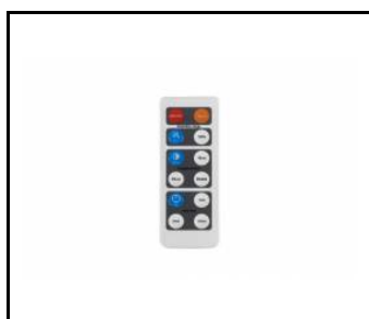
Pilot zdalnego sterowania do czujnika ruchu WSEL438 HD01R. (WSEL438)