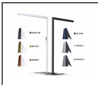
Mřížka -PET Baris Stand GRAYL (744822)