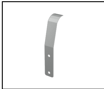
Abdeckung für Halterung Tiara 2 LED 64 mm (989766)

Erstellungsdatum der Karte: 26 März 2025