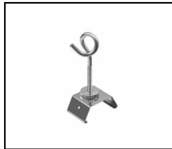
LINEA S LED přívěsek na řetízku (981425)