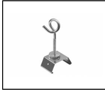
LINEA S LED přívěsek na řetízku (981425)