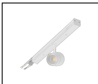
LINEA S LED ECO 588mm - 1xEXPO ADJUST 2050lm DALI zoom 22-55st. Bily 840 20W (594465)