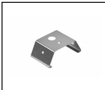
Drazak Linea S LED pro povrchovou montaz (980954)