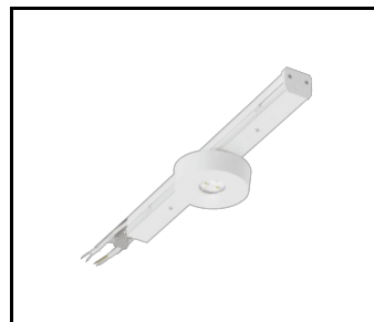
LINEA S LED ECO 588mm 260lm AW DOT CS 2W 1h NM AT (594458)