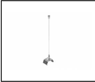
LINEA S LED-Hängeleuchte 1.5m (981173)