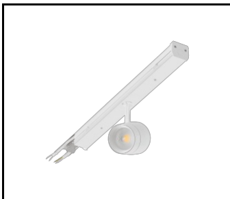
LINEA S LED ECO 588mm - 1xEXPO ADJUST 2050lm DALI zoom 22-55st. Weiss 840 20W (594465)