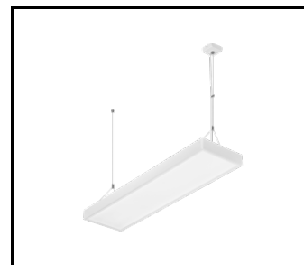
CONTRA LED system zwieszania 1200x300 (374692)