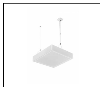
Závěsný systém CONTRA LED 600x600 (374685)