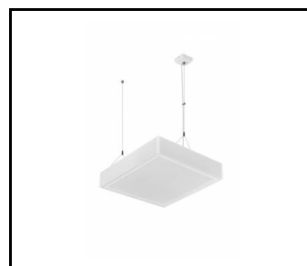
Závěsný systém CONTRA LED 600x600 (374685)