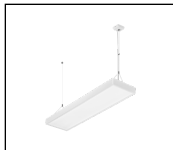
CONTRA Système de suspension LED 1200x300 (374692)