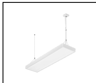
CONTRA Système de suspension LED 1200x300 (374692)