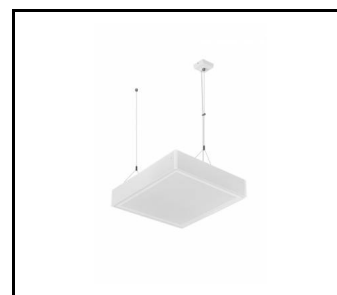
Système de suspension CONTRA LED 600x600 (374685)