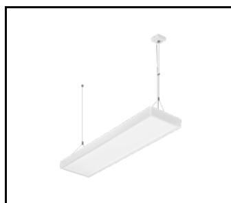
CONTRA Système de suspension LED 1200x300 (374692)