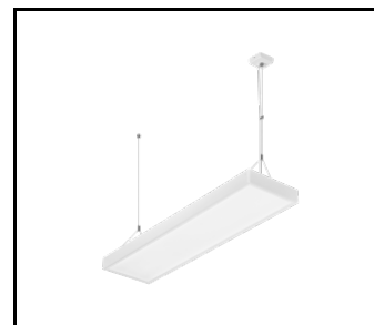
CONTRA Système de suspension LED 1200x300 (374692)