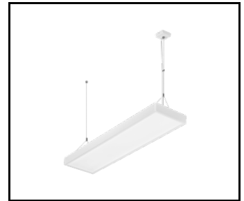
CONTRA LED-Pendelsystem 1200x300 (374692)