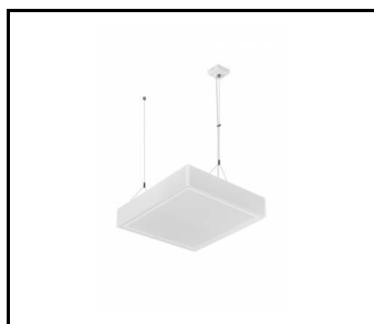
CONTRA LED-Pendelsystem 600x600 (374685)