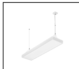
CONTRA LED-Pendelsystem 1200x300 (374692)