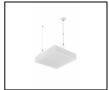
CONTRA LED-Pendelsystem 600x600 (374685)