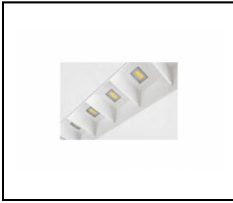
TERRA 2 LED

DETAILLIERTE PRODUKTKARTE TECHNISCHE DATEN