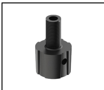
Adaptateur mâle SKVER R filetage M20x40 (pas 2,5) (804427)