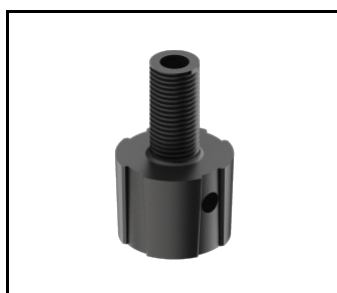
Adaptateur mâle SKVER R filetage M20x40 (pas 2,5) (804427)