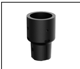
SKVER adaptateur externe fi48 (804571)