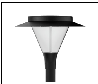
SKVER auvent. modèle 1 RAL9005 (435522)