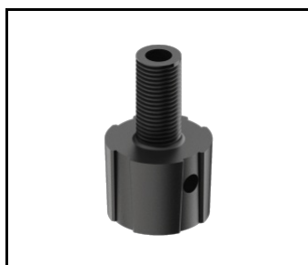
Adaptateur mâle SKVER R filetage M20x40 (pas 2,5) (804427)