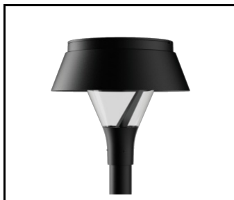
SKVER auvent ULR modèle 2 RAL9005 (421518)