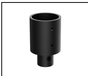
SKVER adaptateur externe fi60 (804588)