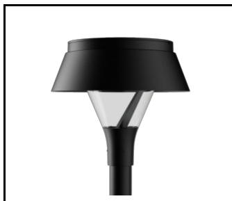
SKVER Reflektor ULR Muster 2 RAL9005 (421518)