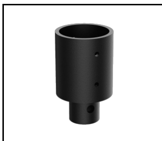
SKVER externer Adapter fi60 (804588)