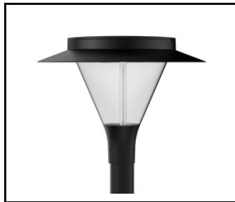
SKVER Reflektor Muster 1 RAL9005 (435522)