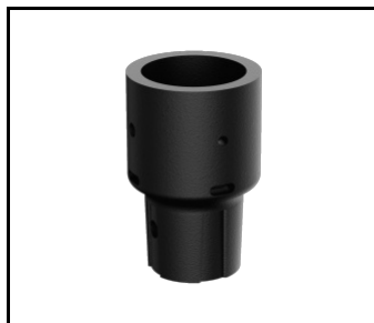
SKVER externer Adapter fi48 (804571)