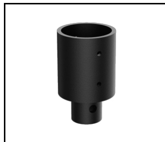
SKVER externer Adapter fi60 (804588)

Erstellungsdatum der Karte: 24 April 2025