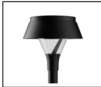
SKVER Reflektor ULR Muster 2 RAL9005 (421518)