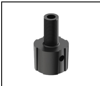
SKVER R Außengewindeadapter M20x40 (Steigung 2,5) (804427)