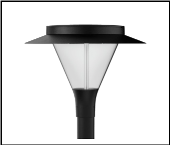
SKVER Reflektor Muster 1 RAL9005 (435522)