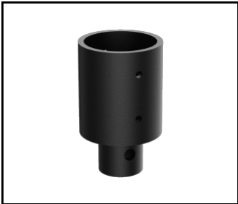
SKVER externer Adapter fi60 (804588)