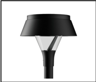
SKVER Reflektor ULR Muster 2 RAL9005 (421518)