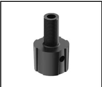
SKVER R Außengewindeadapter M20x40 (Steigung 2,5) (804427)