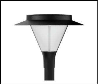
SKVER Reflektor Muster 1 RAL9005 (435522)