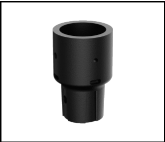
SKVER externer Adapter fi48 (804571)