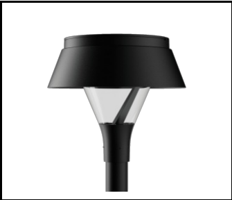
SKVER Reflektor ULR Muster 2 RAL9005 (421518)