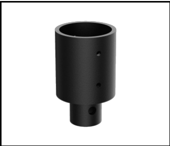
SKVER externer Adapter fi60 (804588)