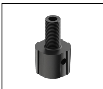
SKVER R Außengewindeadapter M20x40 (Steigung 2,5) (804427)