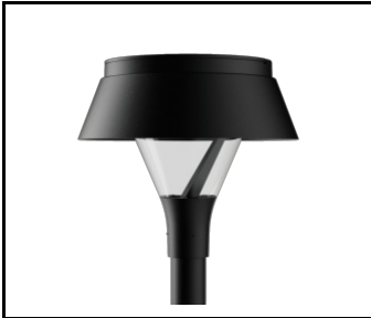
SKVER Reflektor ULR Muster 2 RAL9005 (421518)