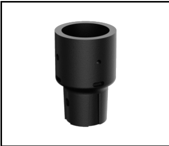
SKVER externer Adapter fi48 (804571)