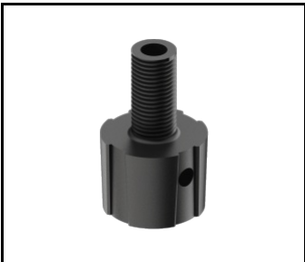
SKVER R Außengewindeadapter M20x40 (Steigung 2,5) (804427)