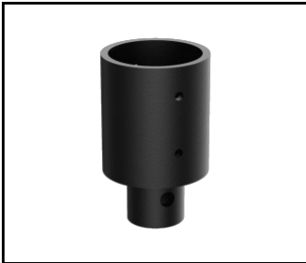
SKVER externer Adapter fi60 (804588)