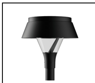
SKVER Hood ULR příklad 2 RAL9005 (421518)