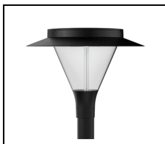
SKVER Hood příklad 1 RAL9005 (435522)