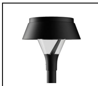
SKVER Hood ULR příklad 2 RAL9005 (421518)