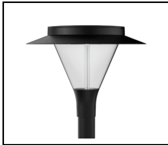
SKVER Hood příklad 1 RAL9005 (435522)