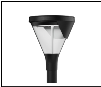
SKVER Backshield RAL9005 (435515)